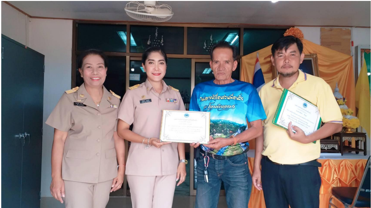
ด้านมนุษยสัมพันธ์ดี