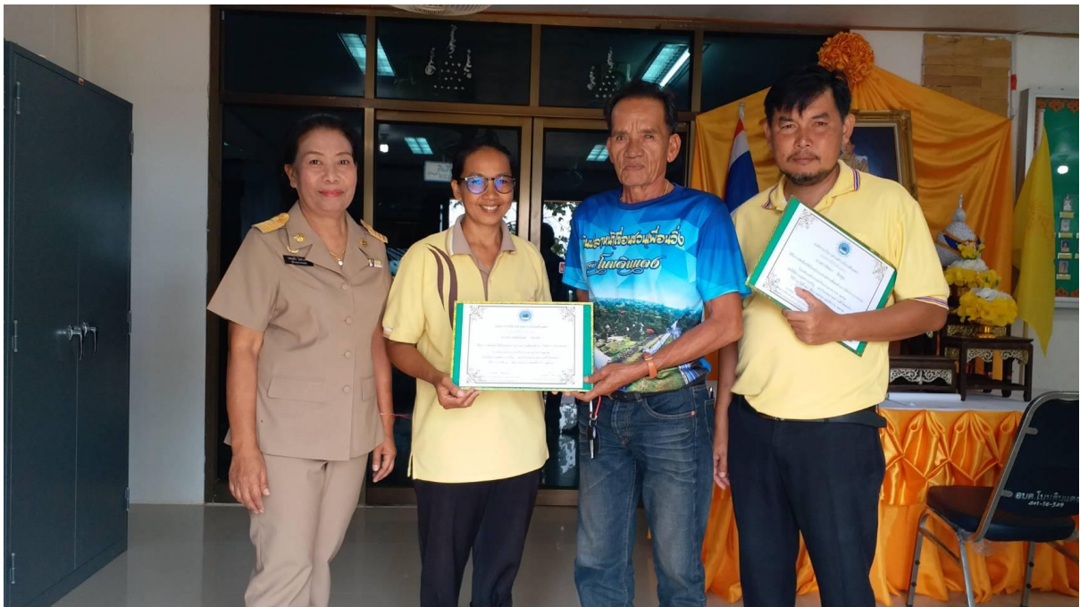
ด้านการบริการดี